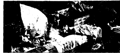
Der einzige Weg aus der Armut ist Bildung: Blick in eine Wohnung, in der auch Kinder leben.

Was bleibt nach so einer Fahrt? Man kann nicht jedes Kind der Welt retten, zumal wir auch in Deutschland Zeugen einer immer größer werdenden Verarmung werden. Aber man kann versuchen, zumindest stellenweise Leid zu lindern.