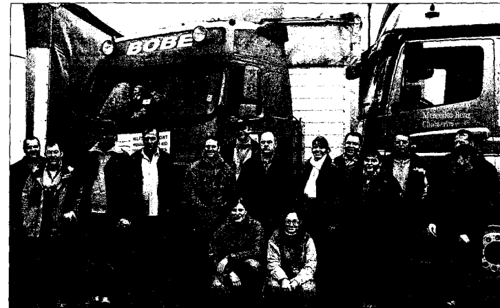
Posieren vor schwerem Transportgerät: Helfer von „Round Table Deutschland“, „Lady Circle“, „Kinderzukunft Rudolf-Walther-Stiftung“ und Elternbeirat Offenbach.