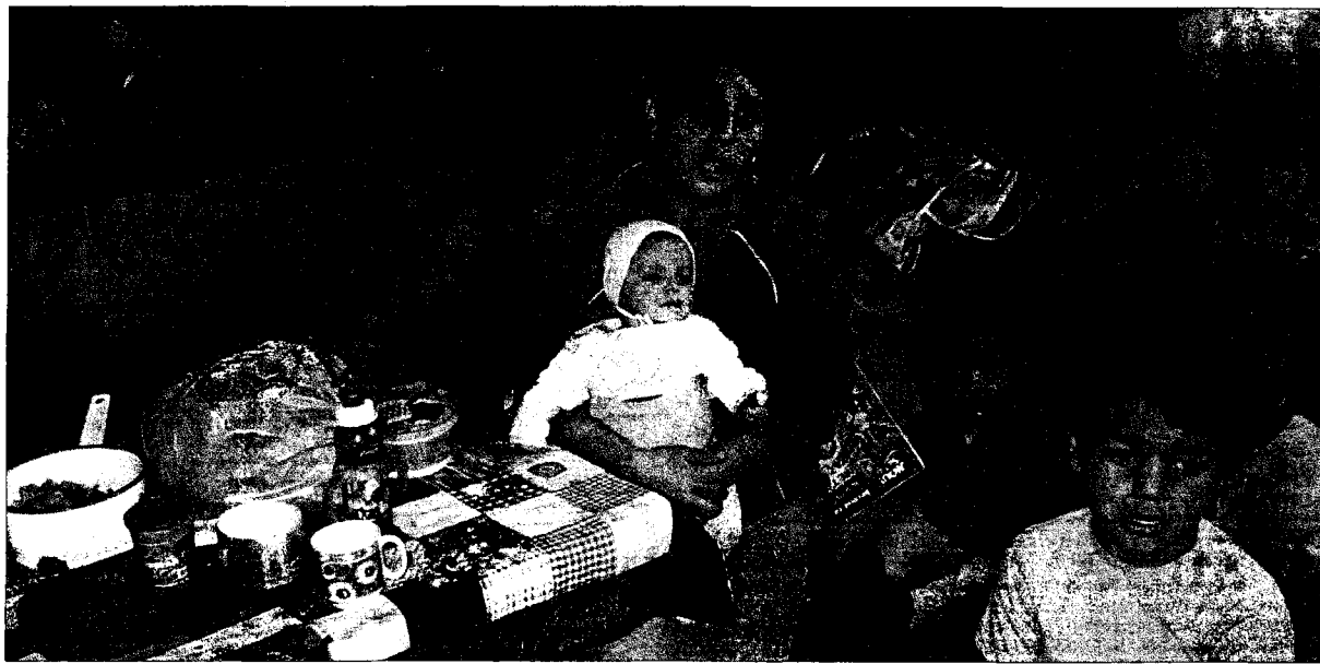
Ganz unten. Auch diese Großfamilie, die in einem Bretterverschlag direkt neben Eisenbahntrassen haust, bekam Besuch aus Deutschland. Die Lage der Kinder hier ist so extrem schlecht, dass auch langjährige Mitfahrer geschockt waren.

Der nächste Tag beginnt genauso trüb und nasskalt wie der letzte aufgehört hat. Wir