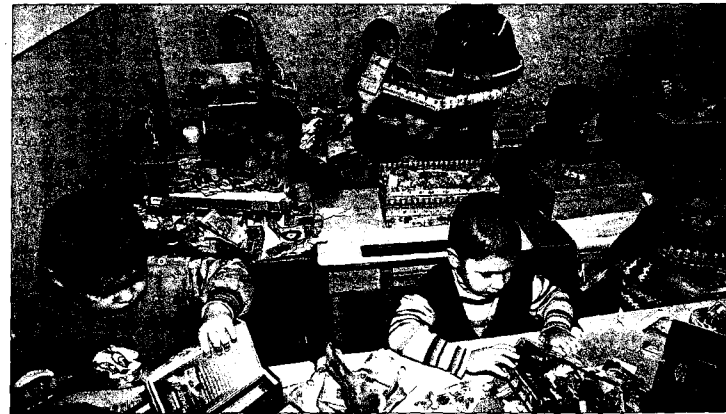
Es wird deutlich mehr getan für Schulen, Sozialeinrichtungen und Heime. Trotzdem sind die Verhältnisse vergleichsweise ärmlich. Umso größer ist die Freude über die Geschenke.