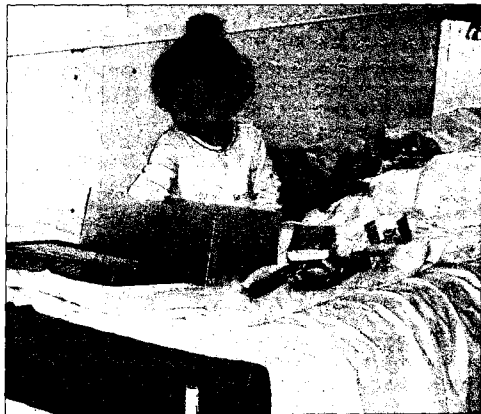
Das kleine Mädchen in einer rumänischen Kinderklinik freut sich über Geschenke von Kindern aus Deutschland.