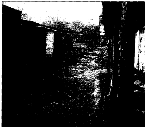
Tristesse extrem. Aktionen wie der Geschenke-transport erhellen Verhältnisse wie diese immerhin mit einem Lichtstrahl.